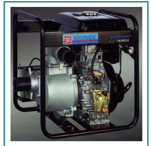
Kennlinie - Diesel-Motorpumpe HL80CLE

Typ HL80CLE ist tragbar und selbstansaugend. Geeignet zum schnellen Auspumpen von Gruben, Gräben, Behältern, Teichen. Zum schnellen (Um)Füllen von großen Behältern und Tanks. Landwirtschaft, Fischzucht, Industrie.