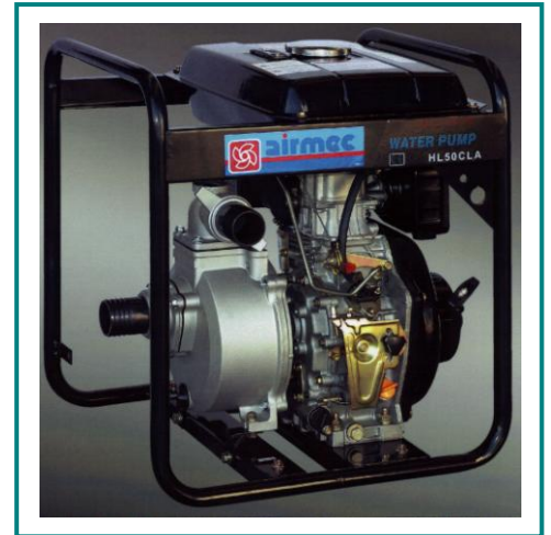
Kennlinie - Diesel-Motorpumpe HL50CLA

Die Motorpumpe HL50CLA ist tragbar und selbstansaugend. Sollte kein elektrischer Anschluss vorhanden sein, kommt diese Pumpe zum Einsatz und dient zur Wasserversorgung und zur Bewässerung für landwirtschaftliche Zwecke.