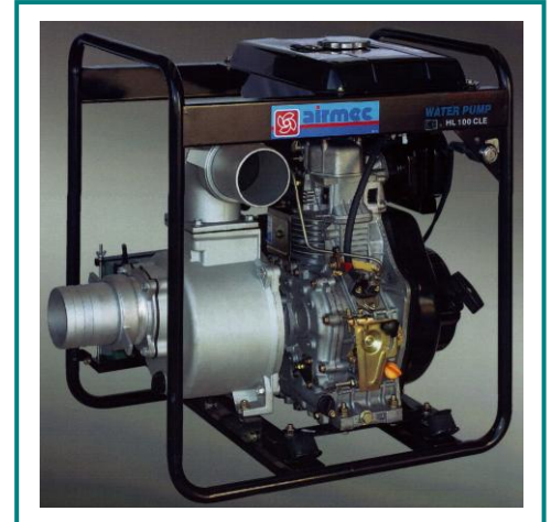
Kennlinie - Dieselmotorpumpe HL100CLE

Typ HL100CLE ist tragbar und selbstansaugend. Geeignet zum schnellen Auspumpen von großen Gruben, Gräben, Behältern, Teichen, Flutungen. Zum schnellen (Um)Füllen von großen Behältern und Tanks. Landwirtschaft, Überschwemmungen.